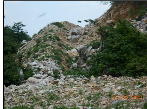
รูปที่ 2-1 แนวเวนการทำเหมืองจากห้วยที่ไม่มีชื่อทางทิศใต้ของคำขอประทานบัตรที่ 3/2553 ในระยะไม่น้อยกว่า 50 ม.