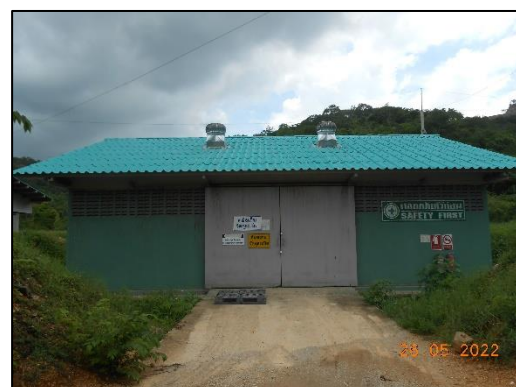
รูปที่ 2-20 คลังเก็บวัตถุระเบิด