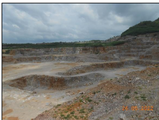
รูปที่ 2-13 การทำเหมืองแบบขั้นบันได