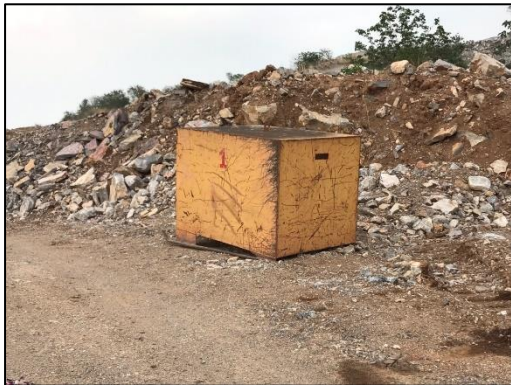
รูปที่ 2-21 กำบังสำหรับหลบขณะทำการระเบิด

คำขอประทานบัตรที่ 1/2555, 4/2555 และหินอุตสาหกรรมชนิดหินปูนเพื่ออุตสาหกรรมปูนซีเมนต์ คำขอประทานบัตรที่ 2/2553, 3/2553, 2/2555, 3/2555, 5/2555, 6/2555, 7/2555 ระหว่างเดือนมกราคม-มิถุนายน พ.ศ. 2565