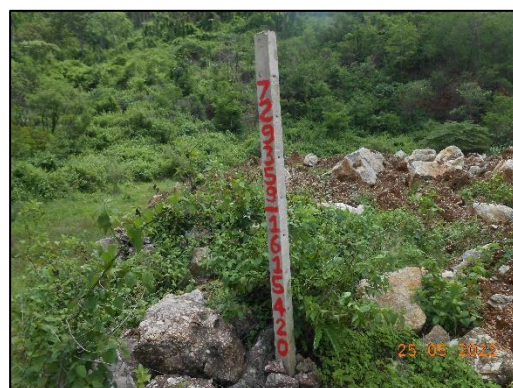
รูปที่ 2-6 ป้ายหรือสัญลักษณ์แสดงขอบเขตพื้นที่โครงการและขอบเขตการทำเหมือง