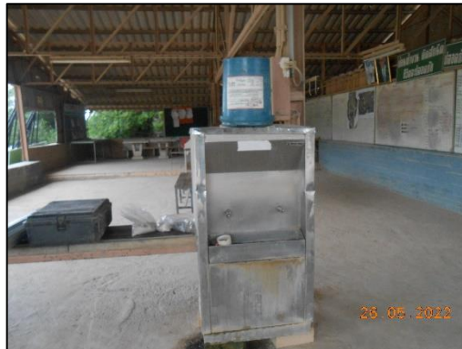
รูปที่ 2-27 ตู้น้ำดื่มภายในโครงการ

คำขอประทานบัตรที่ 1/2555, 4/2555 และหินอุตสาหกรรมชนิดหินปูนเพื่ออุตสาหกรรมปูนซีเมนต์ คำขอประทานบัตรที่ 2/2553, 3/2553, 2/2555, 3/2555, 5/2555, 6/2555, 7/2555 ระหว่างเดือนมกราคม-มิถุนายน พ.ศ. 2565