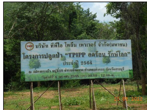
รูปที่ 2-12 การปลูกไม้ยืนต้นเสริมในพื้นที่โครงการ