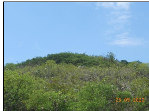
รูปที่ 2-10 พื้นฟูพื้นที่หน้าเหมืองหินดินดานในพื้นที่คำขอ ประทานบัตรที่ 1/2555