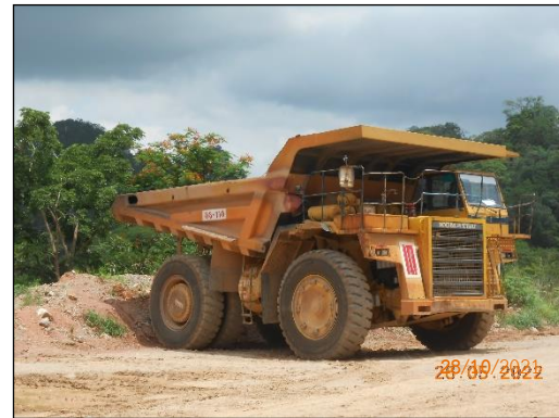
รูปที่ 2-22 รถบรรทุกในการขนส่ง