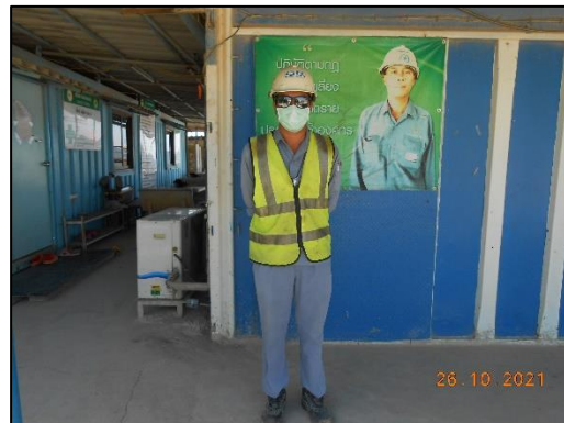
รูปที่ 2-24 การสวมใส่อุปกรณ์ป้องกันส่วนบุคคล