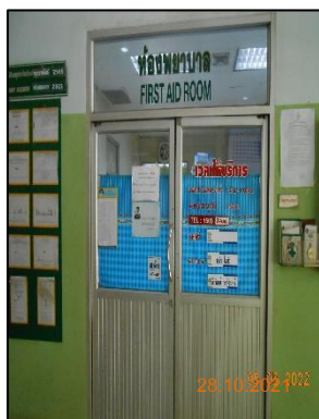
รูปที่ 2-25 ห้องพยาบาล