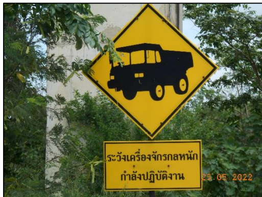
รูปที่ 2-15 การจำกัดความเร็วของรถยนต์ และเครื่องจักรกล

คำขอประทานบัตรที่ 1/2555, 4/2555 และหินอุตสาหกรรมชนิดหินปูนเพื่ออุตสาหกรรมปูนซีเมนต์ คำขอประทานบัตรที่ 2/2553, 3/2553, 2/2555, 3/2555, 5/2555, 6/2555, 7/2555 ระหว่างเดือนมกราคม-มิถุนายน พ.ศ. 2565