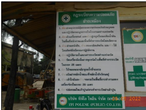
รูปที่ 2-23 ป้ายเตือนภายในโครงการ