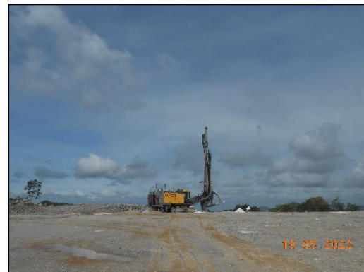
รูปที่ 2-16 เครื่องเจาะระเบิด