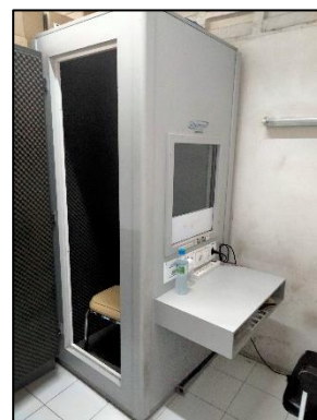
รูปที่ 2-26 ห้องทดสอบการได้ยิน