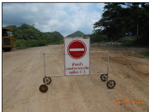
รูปที่ 2-17 ป้ายแสดงเวลาการทำระเบิด