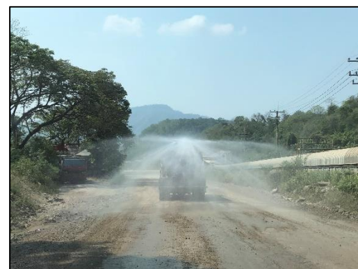
รูปที่ 2-14 การฉีดพรมน้ำ