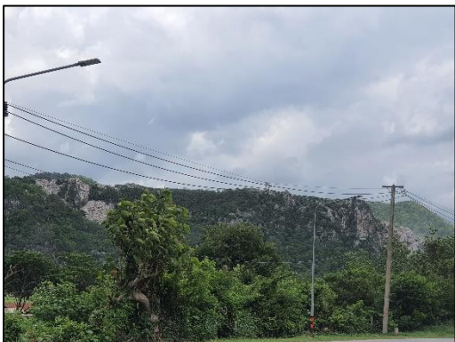
รูปที่ 2-11 เว้นการทำเหมืองจากบริเวณแนวเขาด้านที่ ใกล้กับสถานีวิจัยทับทิม พื้นที่ประมาณ 4 ไร่