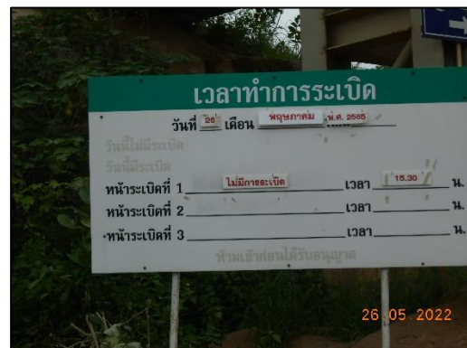
รูปที่ 2-18 ป้ายแสดงการระเบิด